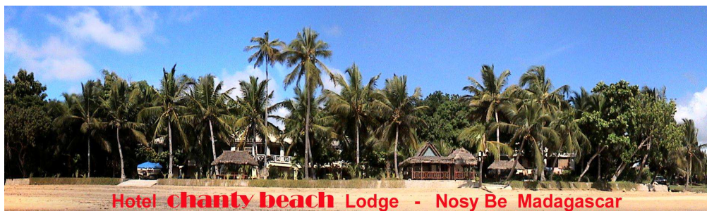
Hotel chanty beach Lodge - Nosy Be Madagascar