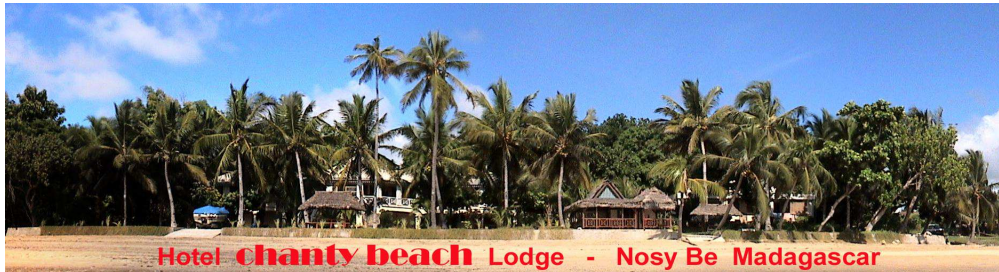
Hotel chanty beach Lodge - Nosy Be Madagascar